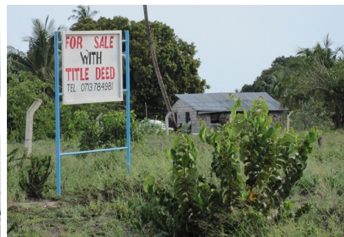
Initiativet LARRI The Land Rights Research Initiative koordineras av GMV och är organisatoriskt en del av Gothenburg Centre of Globalization and Development (GCGD) vid Göteborgs universitet.