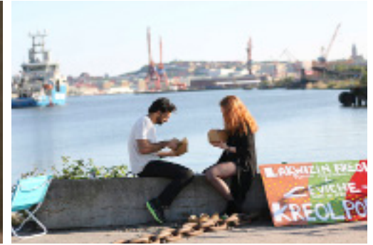
Mistra Urban Futures administrerar ett nätverk för forskare inom hållbar stadsutveckling och urbana frågor på Chalmers och Göteborgs universitet.