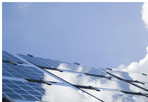
2015 års Göteborgspriset för hållbar utveckling hade temat Energiomställningen – solenergi och energieffektivisering .