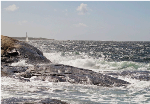
Centrum för havsforskning har haft en viktig funktion i att samordna Göteborgs universitets roll inom den maritima klustersatsningen i regionen, konstateras i en utvärdering av centrumet som gjordes under året.