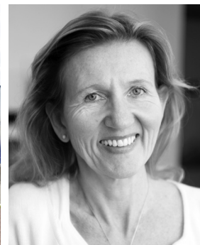
Göteborgs miljövetenskapliga centrum, GMV, är bas för en rad olika centrum och nätverk som möjliggör kunskapsutbyte och gränsöverskridande samarbeten.